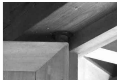
掘込型（上部）取付図