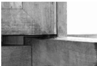
掘込型（下部）取付図